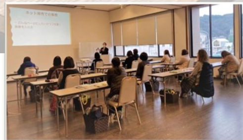
※ 他会場での授業風景